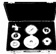
Etui für komplettes Sortiment: Ausführungstypen Abb. 500/1 und Abb. 593 bis 593/4