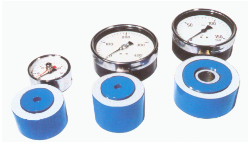
Ausführungstypen Abb. 500/1 und 500/2

Druckmessdosen für statische und dynamische Kraftmessungen mit einer Messgenauigkeit von \pm 1\% vom Skalenendwert (Druckkraftmessdosen mit einer höheren Genauigkeit siehe Blatt D 35). Geeignet für Umgebungstemperaturen von -20^{\circ}\text{C} bis +50^{\circ}\text{C} .